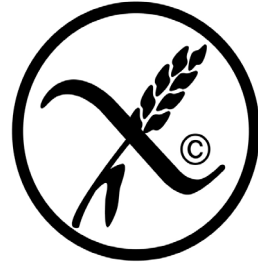
Gluteenittoman tuotteen merkki kertoo, että tuote on tutkitusti gluteeniton.

Gluteenittomia keksejä, muffineita, kääretorttuja, pullia ja leipiä löytyy sekä pakastealtaasta että tuorehyllystä. Etsi paketista Gluteenittoman tuotteen merkki tai merkintä "gluteeniton".